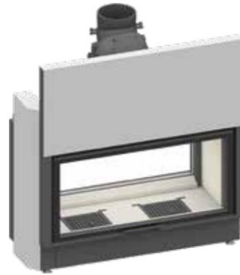
Lina TV 100 avec face avant à guillotine et face arrière à charnières